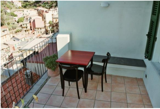
Terrasse, Blickrichtung Dorf