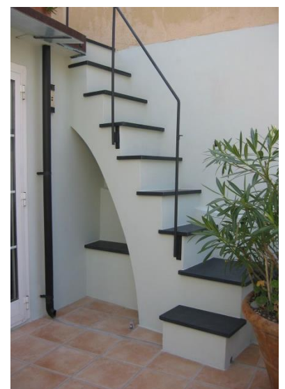
Aufgang von Küchenterrasse zur Dachterasse