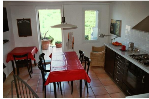
Küche, Richtung Terrasse