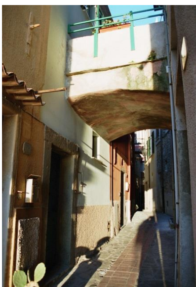
Eingang Via Belvedere Blickrichtung Dorf