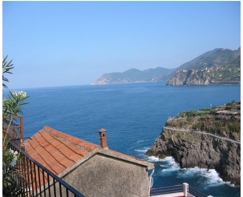
Ausblick von der Terrasse in Richtung Monterosso