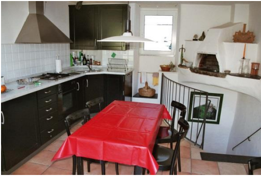
Küche, Blickrichtung Belvedere