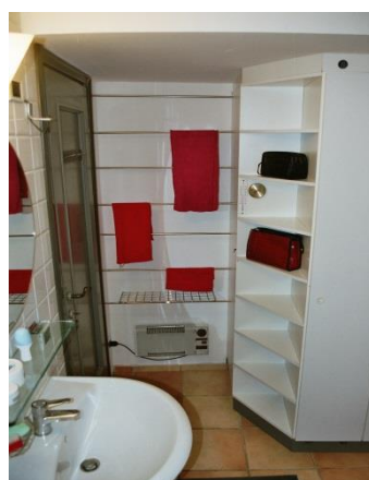
Ablagen Dusche 1