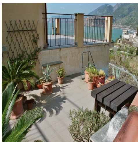
Dachterasse Blickrichtung Monterosso